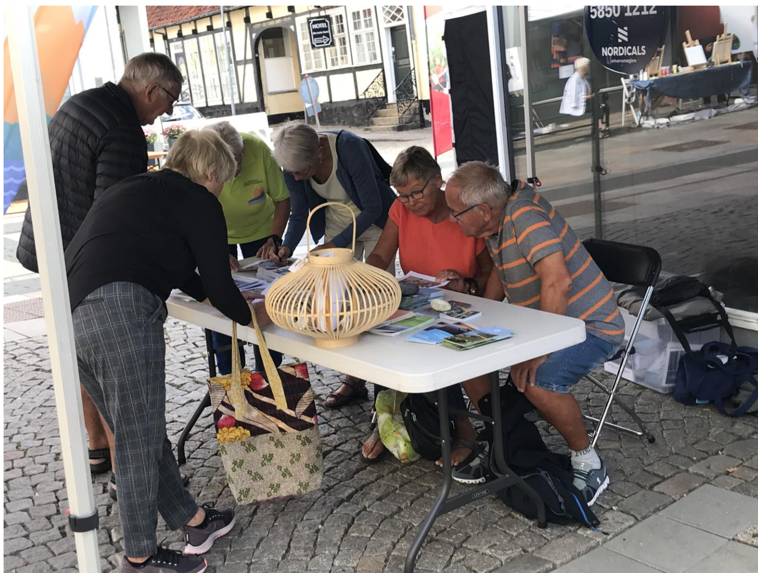
Foto fra Bevæg Festival 2022. Koncentration om at "finde fem fejl".

I vil kunne finde os centralt i Kordilgade. Vi håber mange medlemmer kigger forbi.